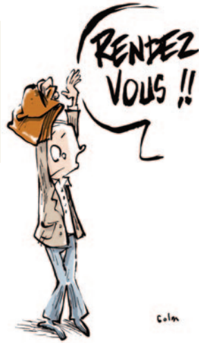
RENDEZ-VOUS DE CARRIÈRE

“ Aujourd'hui, j'ai reçu l'appréciation finale de l'IA-DASEN : « Satisfaisant » alors que ma note d'inspection est de 18/20 et que dans le tableau il y avait coché (4 satisfaisants – 6 très satisfaisants et 1 excellent) et que l'appréciation de l'IEN était très bonne. Sur quels critères s'est-elle arrêtée ?